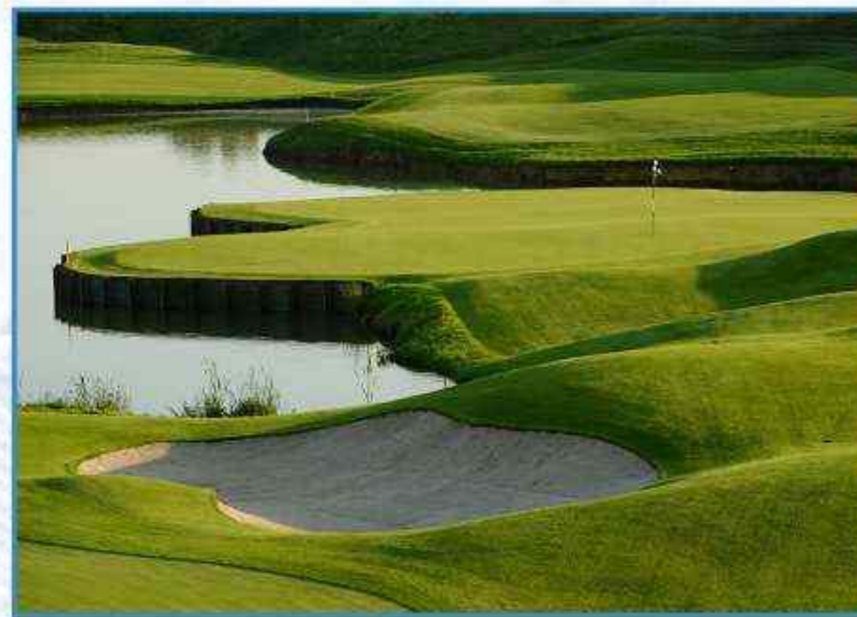
Pelouse soignée d'un golf (Saint-Quentin-en-Yvelines)

...selon les sols et le climat, ses moyens, ses goûts.