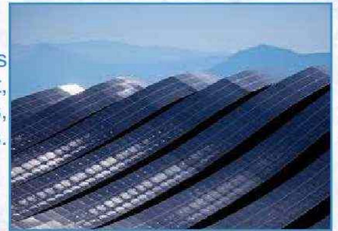
Ferme solaire (Alpes-de-Haute-Provence)

...selon les sols et le climat, ses moyens, ses goûts.