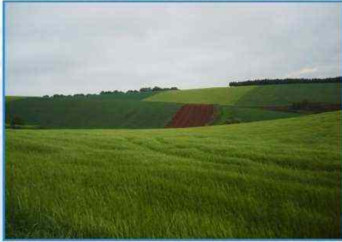
Champs de céréales