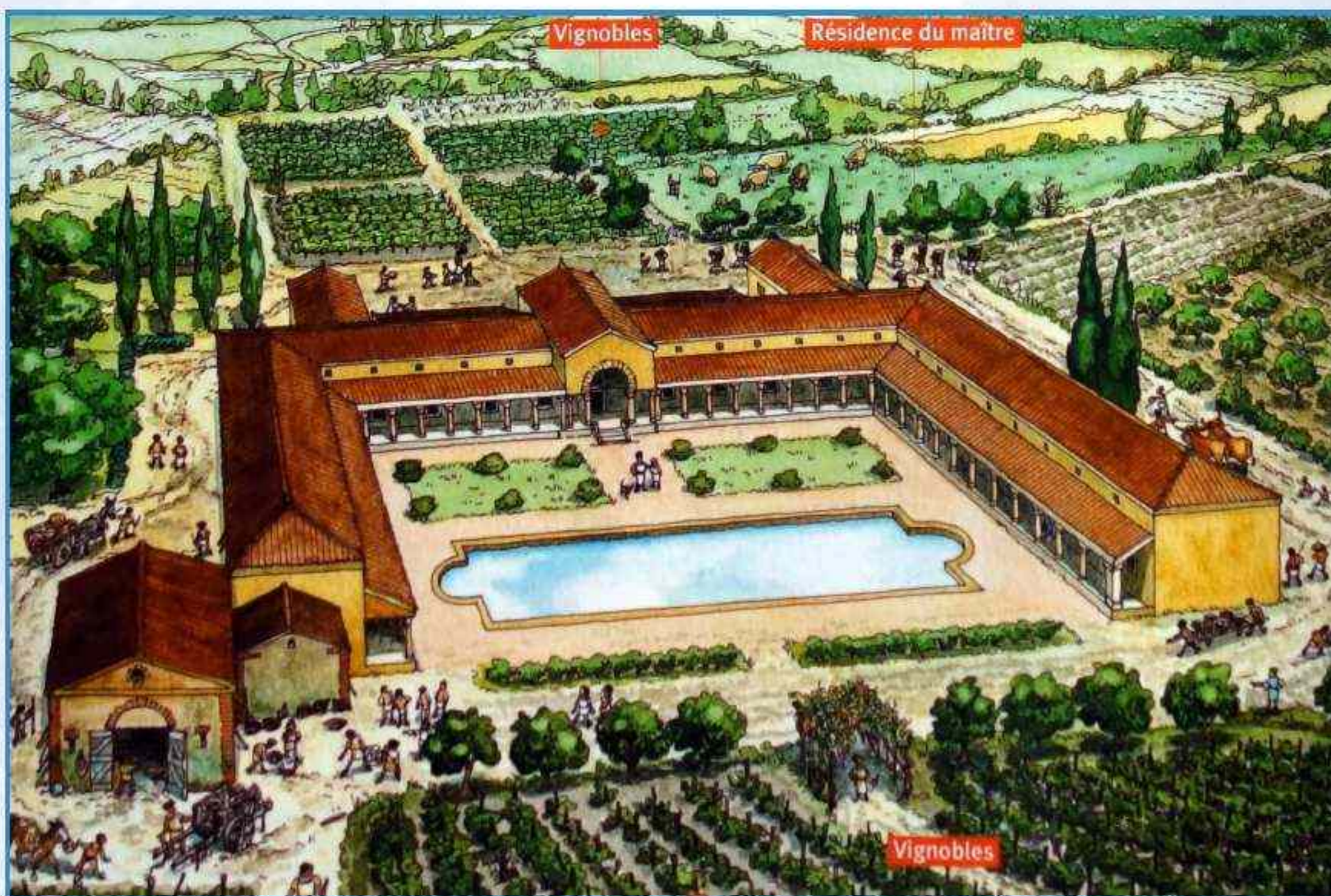
Reconstitution de la villa romaine du Palat (SAINT-EMILION)

Dès l'époque gallo-romaine, ont été pratiquées dans notre région cultures vivrières et cultures commerciales.