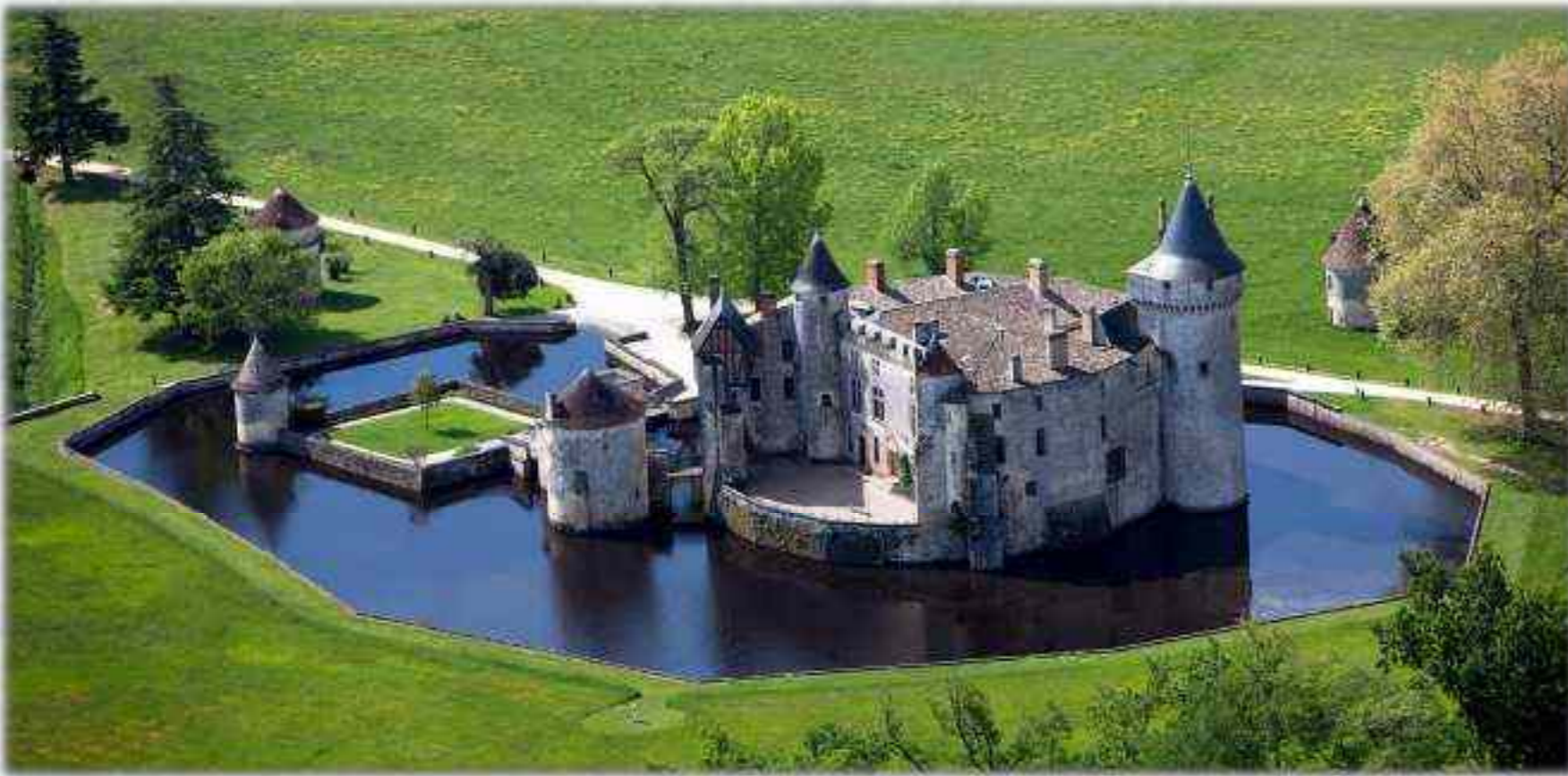
Château de la BREDE( 33)

Les châteaux féodaux de défense évoluent en résidence de plaisance pour les nobles