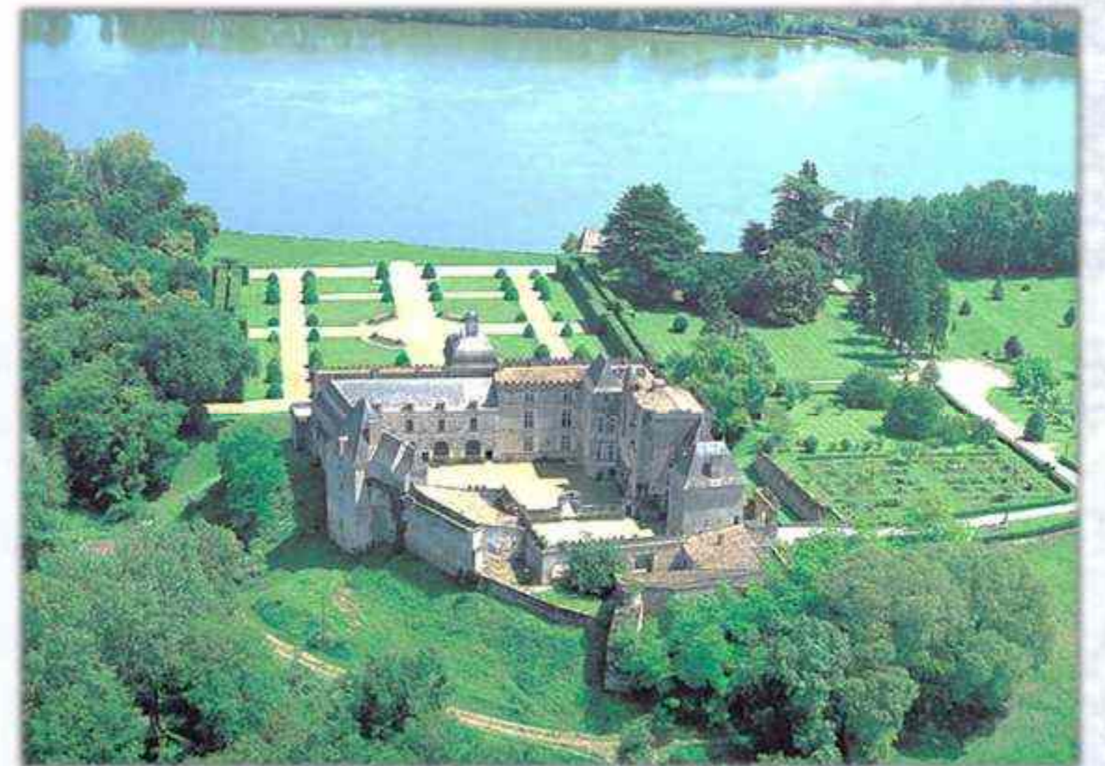
Château de VAYRES (33)

Témoin de la fin de la féodalité, ouvert et entouré de bois, prairies, terres labourables, vignobles. Il a un aspect de forteresse sans avoir eu de rôle défensif.