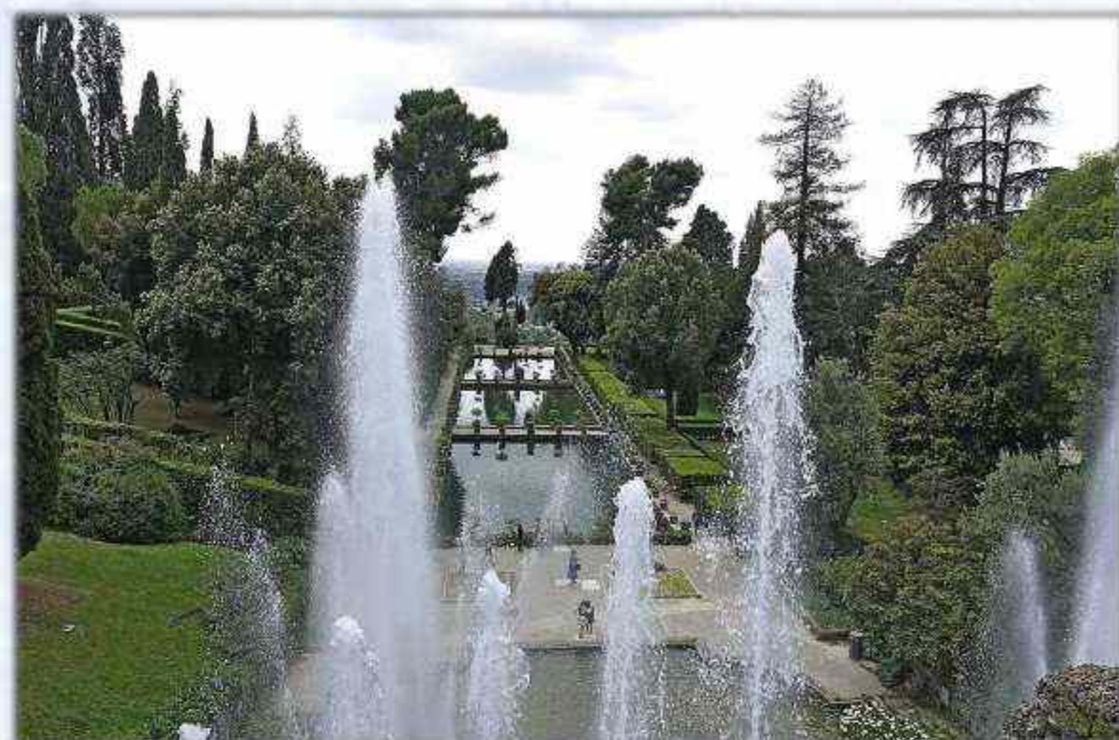
Les viviers de la villa d'ESTE