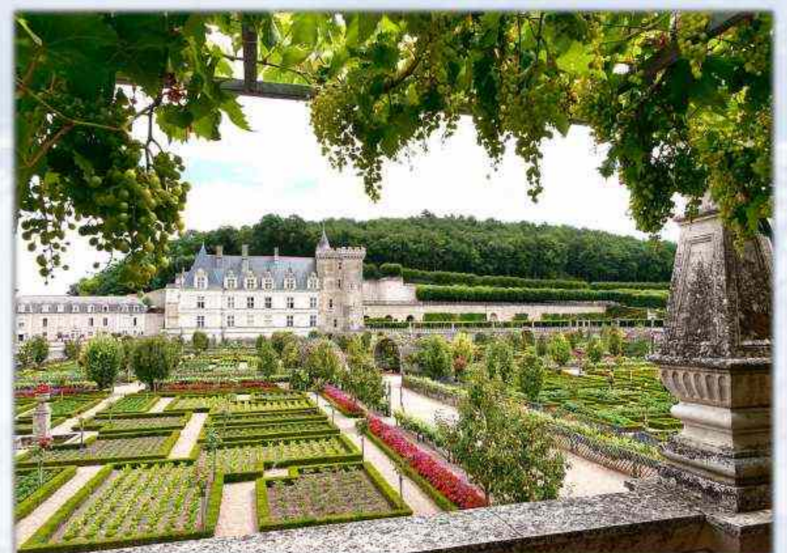
Château de VILLANDRY, Centre - Val de Loire

Les jardins de la villa d'Este ont exercé une très grande influence sur les créations paysagères d'Europe. Pour les multiples fontaines des jardins, des techniques romaines d'approvisionnement en eau ont été reprises.