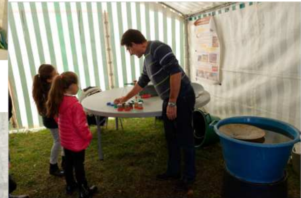
La masse? la densité? Les élèves très attentifs