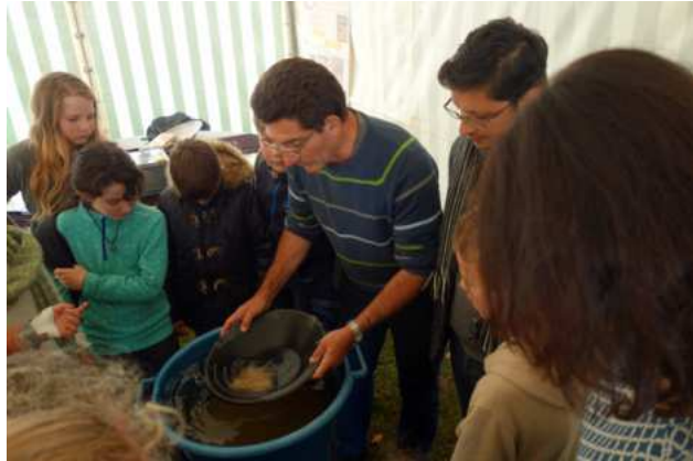
Tout est dans le geste ..