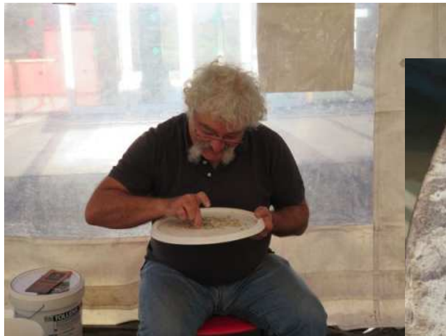
J'ai trouvé.... Du plomb !