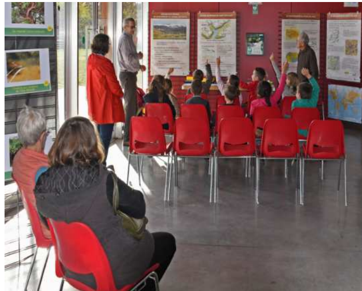
Deviner le paysage en regardant une carte