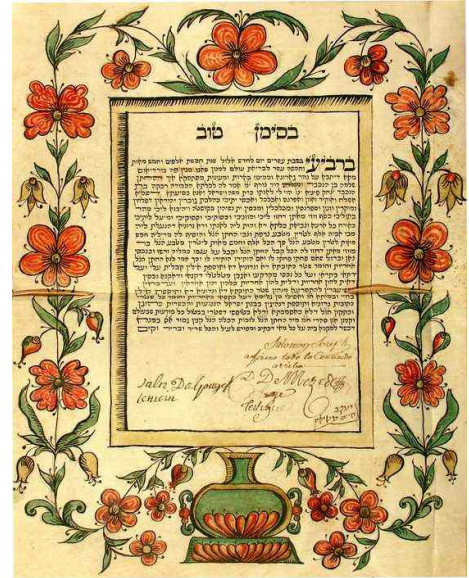
Contrat de mariage de juifs bordelais - 1760