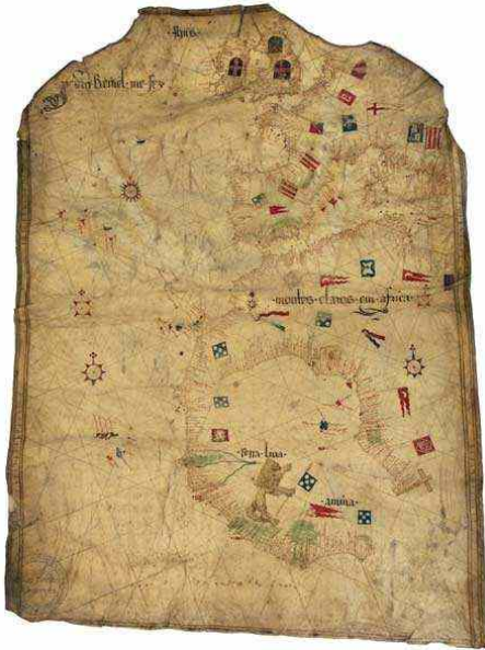
Portulan de Pedro Reinel, ca. 1485, parchemin, couleur, 95 x 71 cm